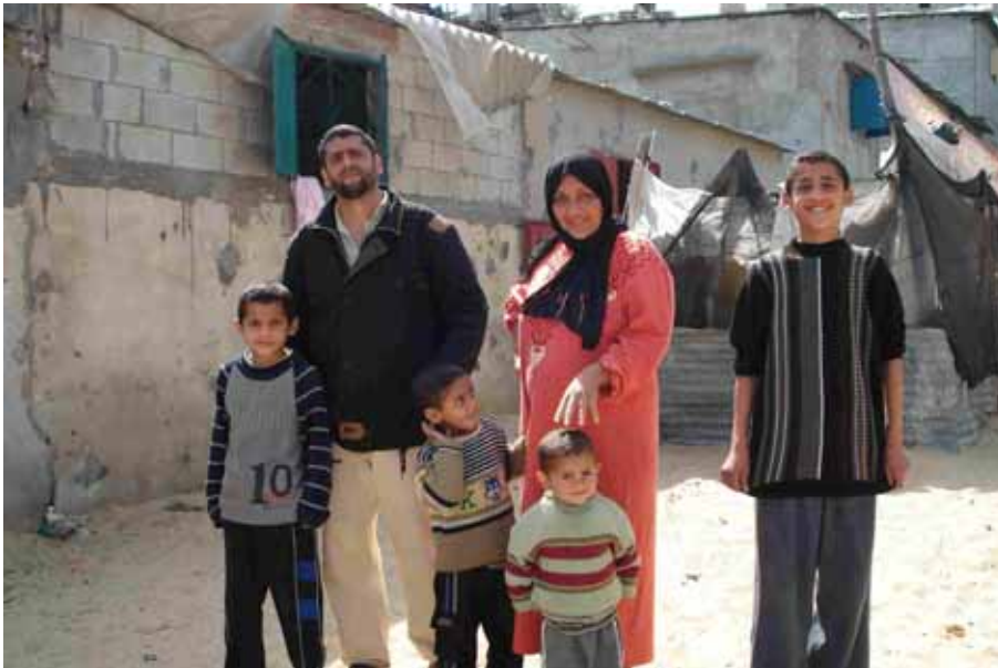
Famiglia di Khan Yunis di fronte alla sua casa

con lo stipendio di 3 mesi (lavora per la Union di Donne di Palestina) e uno di suo marito (ingegnere). Sono stati i suoi rapporti con la gente (tramite anche una associazione che ha fondato in paese) che è stata eletta in una situazione in cui o sei di Fatah, o sei di Hamas o di un clan. Tra l'altro emerge abbastanza chiaramente che la sconfitta di Fatah è stata una punizione della gente contro il governo corrotto e poco efficiente di Fatah. Insomma una donna forte. Con idee precise. La sua associazione si occupa di donne, bambini e giovani (maschi e femmine).