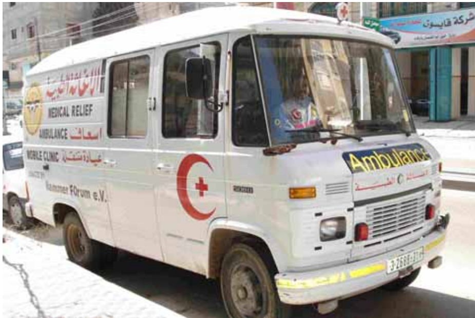
Autoambulanza del Medical Relief di Gaza

Ieri sono stata impegnata dal report che dovevo scrivere e quindi alle 7.30 di sera avevo il cervello fuso e vi ho pensato ma non ce la facevo nemmeno piu' a dire "ciao, sto bene" anche perche' avrete finalmente capito che qui la situazione e' totalmente calma (finche' non succede qualcosa). I soli uomini armati sono i poliziotti, ma non hanno tanto l'aria di fare sul serio. Inoltre qui ogni tanto manca la corrente e anche se il palazzo ha il generatore e i computer sono abbinati a delle batterie, il rischio di perdere i testi c'e' sempre: se manca la corrente e' meglio salvare, chiudere ed aspettare che torni la corrente.