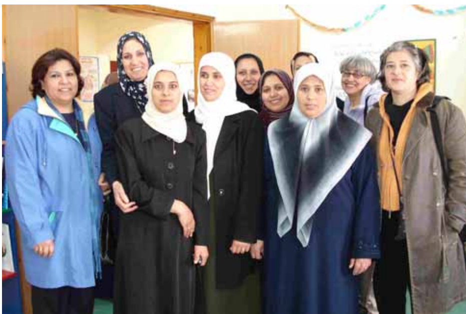
Centro di formazione di donne di Beit Hanoun, Nord Gaza

Insomma siamo collegate con il mondo ma a che serve se sei chiusa dentro?