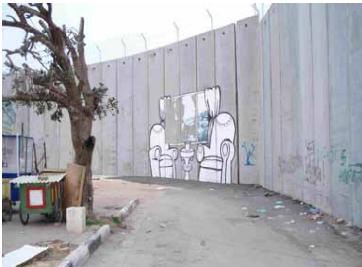
Muro vicino al "Terminal" di Betlemme

Baci. Altri dettagli (allegri e tristi) e ulteriori considerazioni politiche a voce.