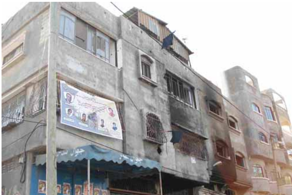
Sede di Al Fatah di Jabalya, bruciata nel corso degli scontri del gennaio 2007

Per ora mi fermo qui. Tutto sembra tranquillo. Il muezzin sta intonando la preghiera della sera: insomma ecco Gaza. A domani.