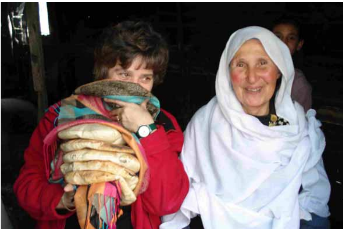
Ed ecco il pane che ci hanno regalato!