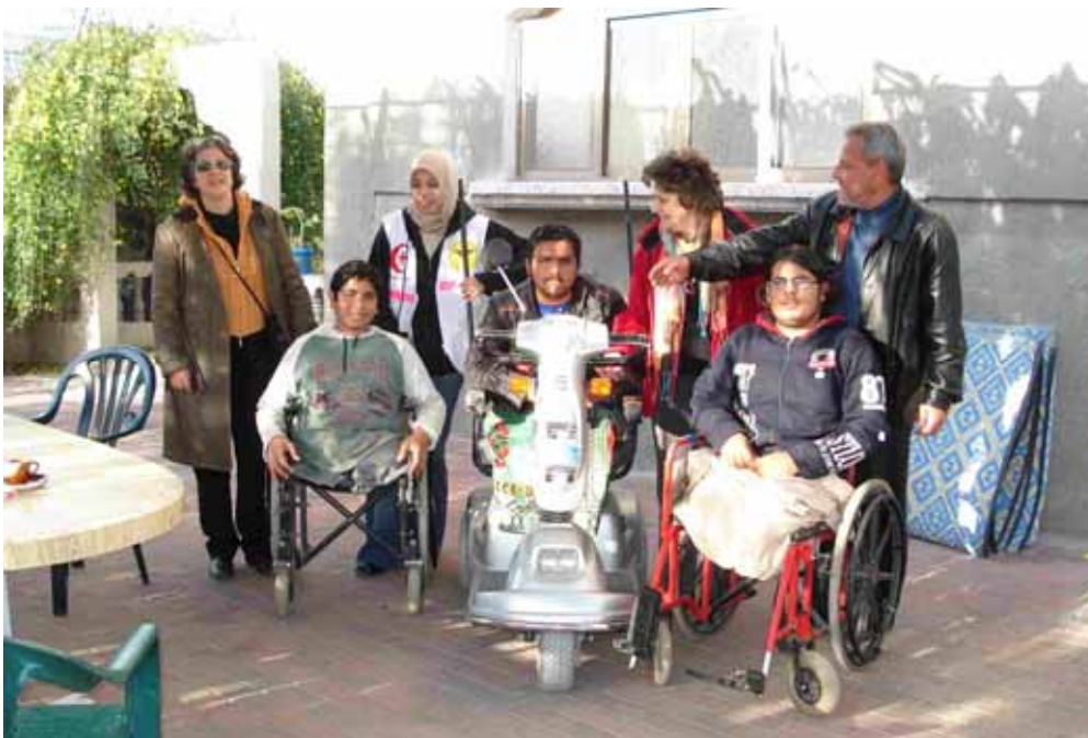
Tre ragazzi feriti due anni fa da coloni israeliani a Beit Lahkiya

Sembra una storia alla Milani, quello di "Che tempo che fa". Forse un po' sconclusionata, ma con molte possibili letture.