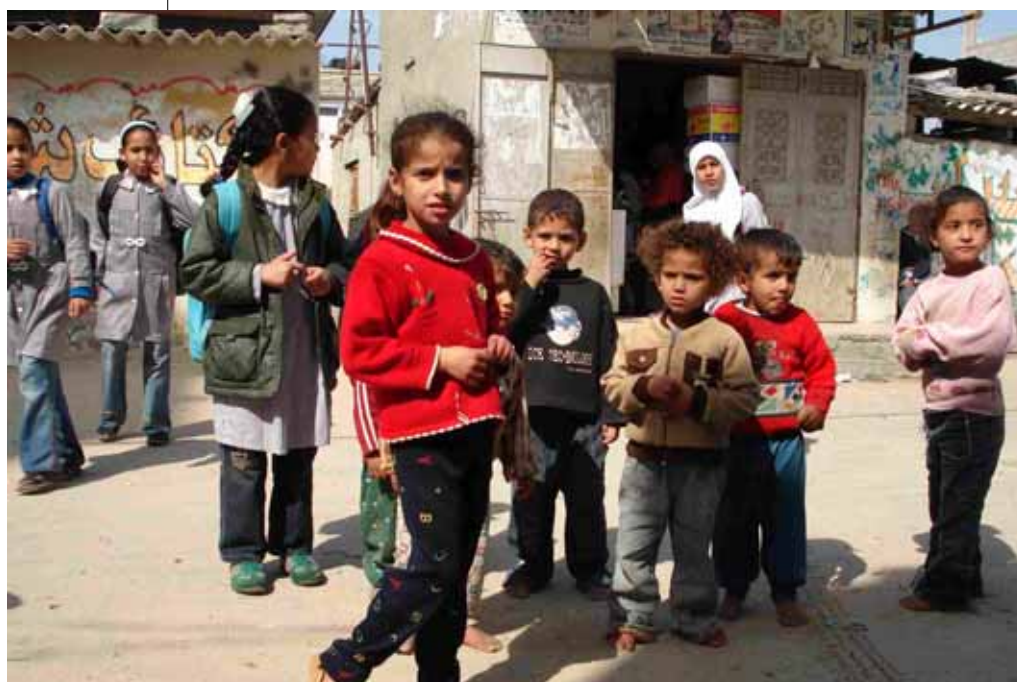
Bambini di Khan Yunis, Gaza

Eppure a Gaza la vita continua, ed ha il volto di una normale vita per la sopravvivenza, dove il futuro è sempre più incerto, ma dove vivere significa certamente resistere. Da 60 anni.