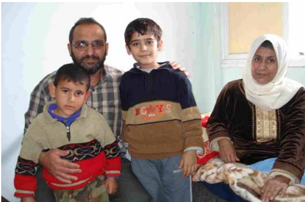
Famiglia di Bei Lahiya. Nei bombardamenti dell'agosto scorso hanno perso un bambino. Questi due sono stati gravemente feriti. La mamma ha una gamba distrutta.

Ins'hallah (o come si scrive) Arrivederci.