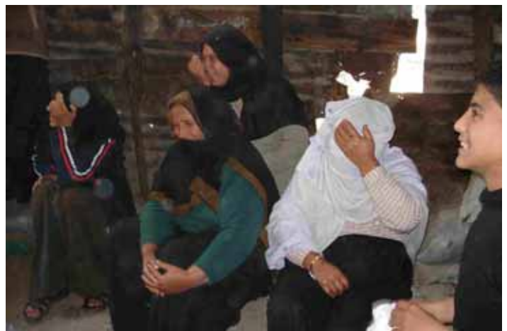
In attesa del pane si scherza...

Il pane era una meraviglia. Ce l'hanno regalato, siamo state con loro, veniva voglia di esserne parte, di riuscire a condividere di più. Piccoli spicchi di vita