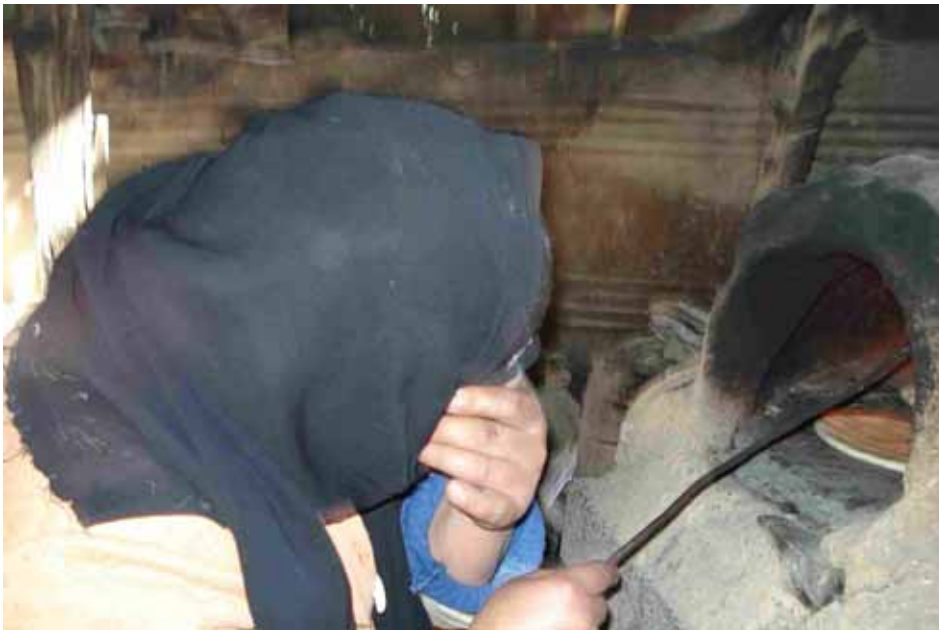
Donna di Rafah che prepara il pane..

Anzitutto abbiamo sistemato alcuni punti con il WAC che erano nel progetto del CRIC e per loro importanti rispetto al committente ECHO e poi siamo andati a Sud accompagnati da una impiegata del Medical Relief: Khanyunis e Rafah. Abbiamo cioè continuato a visitare famiglie varie di bambini feriti con il Medical Relief, che devo dire ha costituito una preziosa opportunità per rendersi conto di varie storie di miseria e di diffusa povertà, di disoccupazione degli uomini, di famiglie con 6 o 7 figli se va bene, (ma in questi paesoni agricoli la media è più alta), di famiglie talvolta che comprendono due mogli e comunque molto spesso con nuclei familiari estesi, e tutti abitano nello stesso edificio. Insomma un'umanità che si arrabatta per sopravvivere e lo fa più o meno bene. Ci sono in queste famiglie probabilmente scale gerarchiche, poteri che non si colgono, un'infanzia che rapidamente finisce, ma anche una capacità di sopravvivere che noi non ci sogniamo di avere.